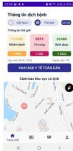
Số liệu thống kê dịch trên Thế giới